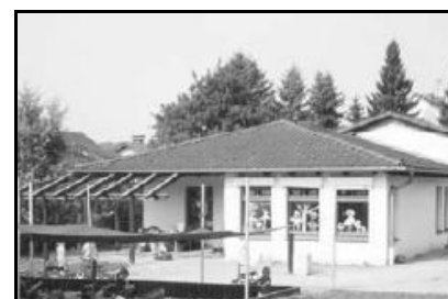
Gibt es in Husen eine 2. Kindergartengruppe?